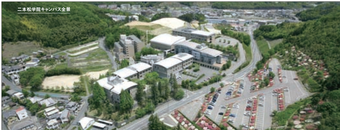
二本松学院キャンパス全景