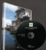
ARTLANTIS STUDIO 3