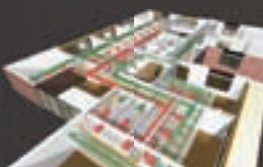
MEP Modeler (設備)