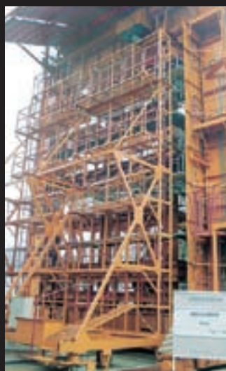
第2回層間変位追従性能試験 観察状況(その1) 〔層間変位量1/60,+63.3mm〕 第2回層間変位追従性能試験 観察状況(その4) 〔層間変位量1/60,+63.3mm〕

あらゆる建築材料、工法の耐震、免震性能について弊社として専門的な免震性能テストを行い、更に新材の構成と改良により従来の「M式ツリコ」に加えて、より安全性と施工性に優れた免震防煙壁「MTタイプ」の開発に至りました。