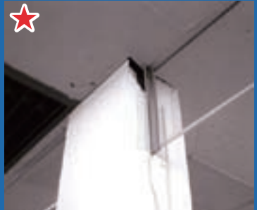
柱がこんなに大破しても異常ナシ(震度6強地区)