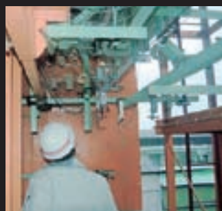
第2回層間変位追従性能試験 観察状況(その5) 〔層間変位量1/60,+63.3mm〕