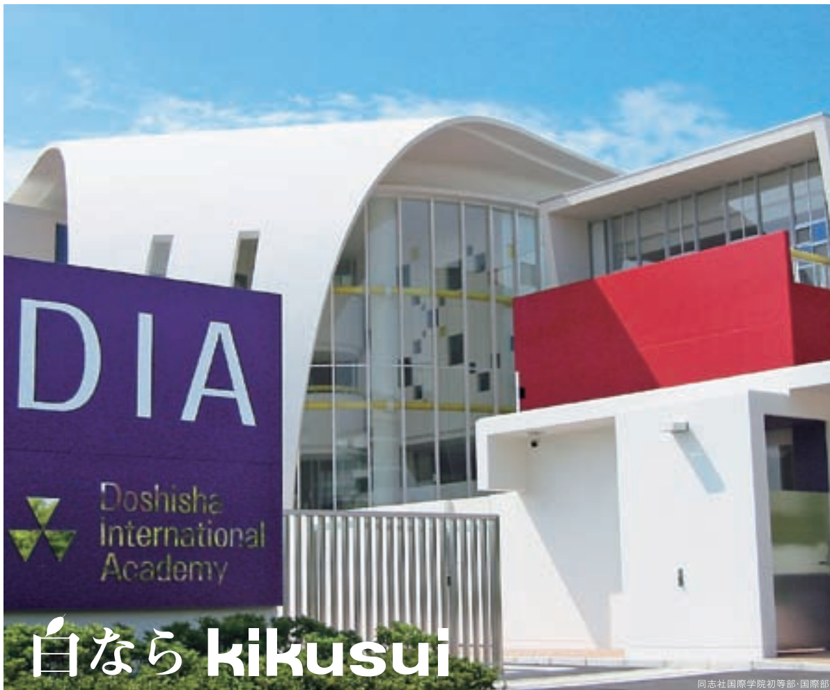
同志社国際学院初等部・国際部