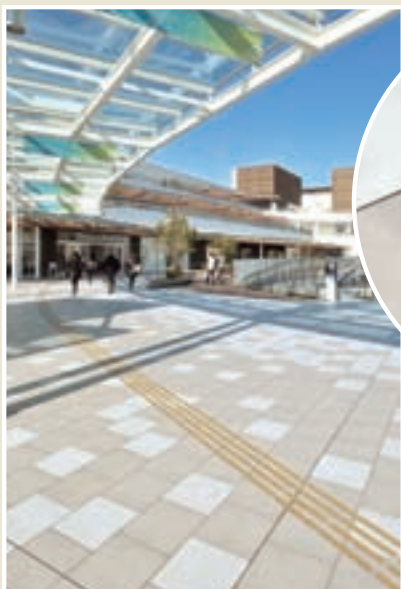
300角(9mm厚) 磁器質 施釉 フェイスガードタイル