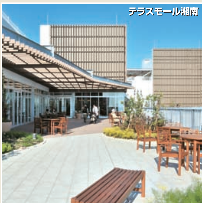
テラスモール湘南