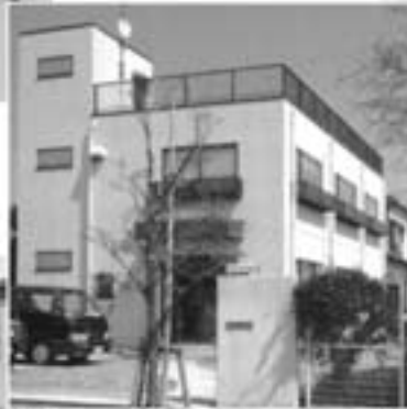
テクニカルセンター