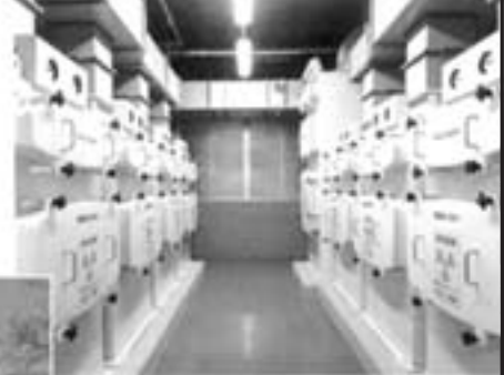
排気フィルターユニット