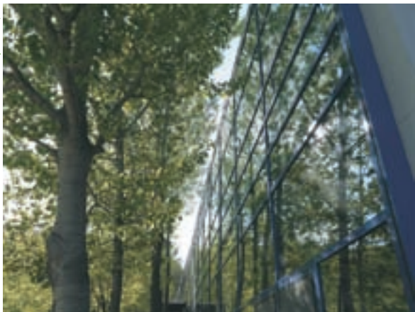
第9回 JIA 環境建築賞 最優秀賞受賞

ピーエス IDIC 研究開発及び加湿器、冷暖房用ラジエータの生産拠点 (岩手県八幡平市)