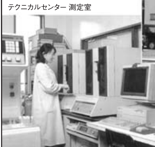
テクニカルセンター 測定室