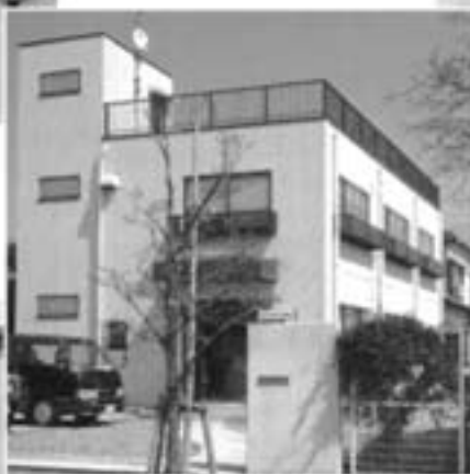
テクニカルセンター