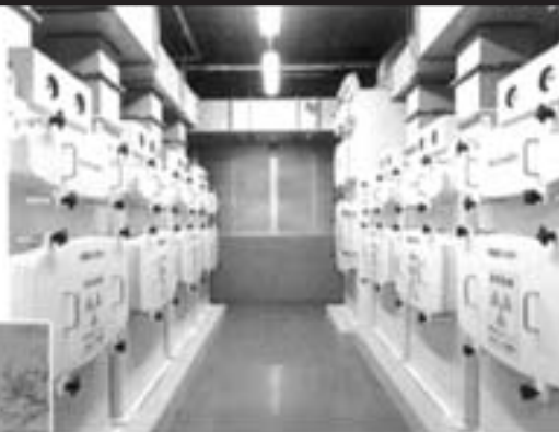
排気フィルターユニット