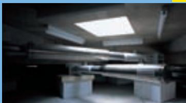
岐阜県総合医療センター