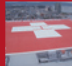
ALUMINUM HELIPORT Matsue Red Cross Hospital