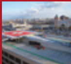
SLIDING HELIPAD Teine Keijinkai Hospital