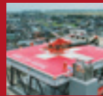
ALUMINUM HELIPORT Kurobe City Hospital