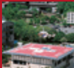
ALUMINUM HELIPORT Tsukuba Medical Center Hospital