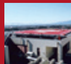
ALUMINUM HELIPORT Gifu University Hospital