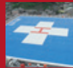
ALUMINUM HELIPORT Uwajima City Hospital