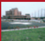
GROUND HELIPORT Awa-Ishikai Hospital