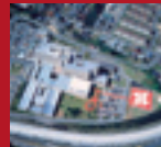
GROUND HELIPORT Iida Municipal Hospital