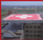
ALUMINUM HELIPORT Kushiro City General Hospital