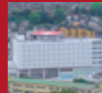
ALUMINUM HELIPORT Nagasakiken Saiseikai Hospital