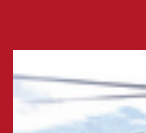
ALUMINUM HELIPORT Antarctic Showa Station