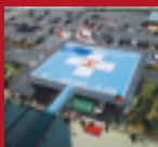
ALUMINUM HELIPORT Teikyo University Chiba Medical Center