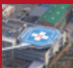
ALUMINUM HELIPORT Numazu City Hospital