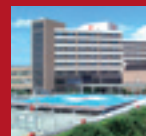
ALUMINUM HELIPORT Japanese Red Cross Kumamoto Hospital