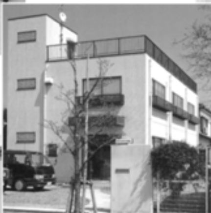
テクニカルセンター