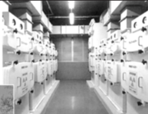
排気フィルターユニット