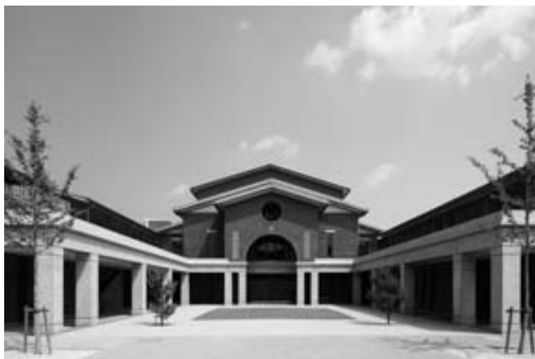
同志社中学・高等学校