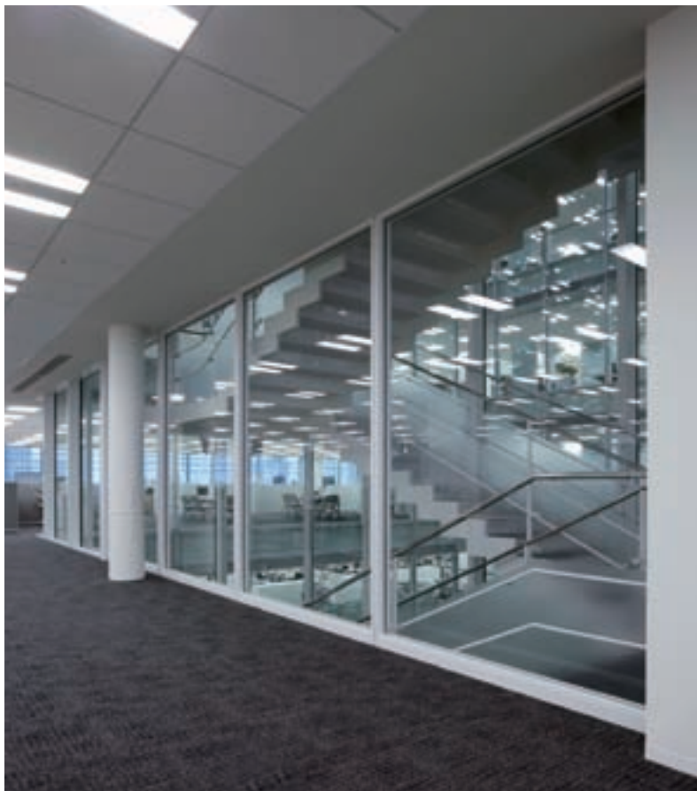
日産自動車グローバル本社