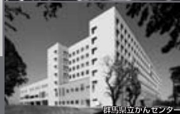
群馬県立がんセンター