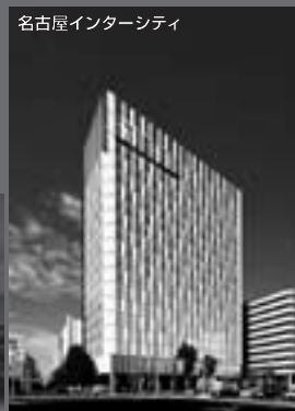
名古屋インターシティ