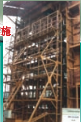
第2回層間変位追従性能試験観察状況 (その1) (層間変位量1/60,+63.3mm)