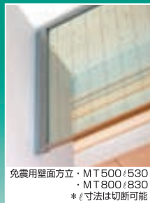
免震用壁面方立・MT500/530 ・MT800/830 * /寸法は切断可能

(弊社製品は、工業所有権を 保有しております。) ユーザーにご迷惑を及ぼす 類似品については十分ご注意ください。