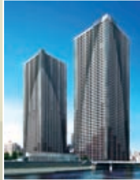
●THE TOKYO TOWERS 施工 / 前田建設工業株式会社