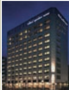
●四谷1丁目計画 施工 / 日本国土開発株式会社