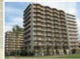
●萩山公園プロジェクト 施工 / 西武建設株式会社