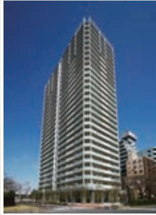
●ブラウドタワー練馬 施工 / 前田建設工業株式会社