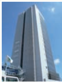
●ジャパン建材本社ビル 施工 / 前田建設工業株式会社