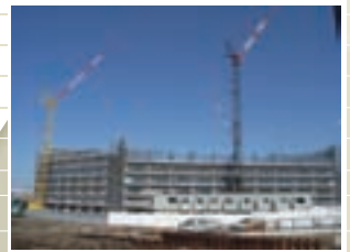
●平井七丁目計画(施工中) 施工 / 前田建設工業株式会社