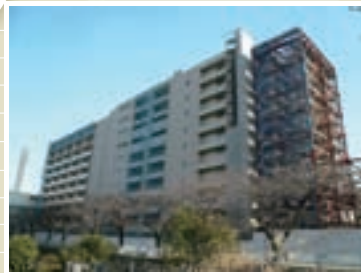
●横浜住宅 施工 / 名工建設株式会社