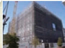
●青海シーサイド(施工中) 施工 / 前田建設工業株式会社