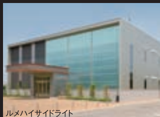
ルメハイサイドライト

断熱・自然採光エコロジーライティングパネル Lume High-side light ルメハイサイドライト