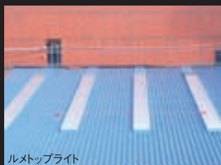
ルメトップライト