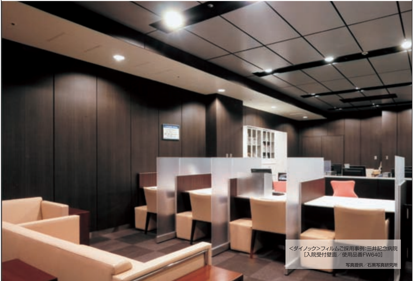
<ダイノック>フィルムで採用事例:三井記念病院 [入院受付壁面/使用品番FW640]