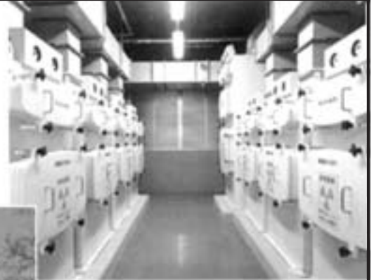
排気フィルターユニット