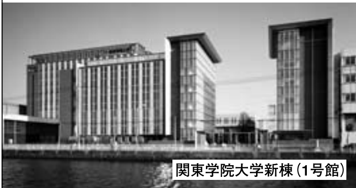
関東学院大学新棟 (1号館)