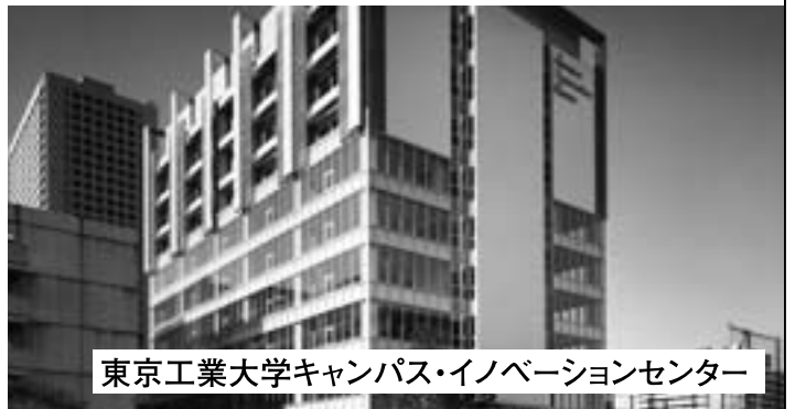
東京工業大学キャンパス・イノベーションセンター