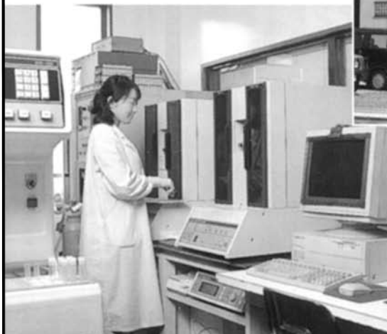
テクニカルセンター 測定室