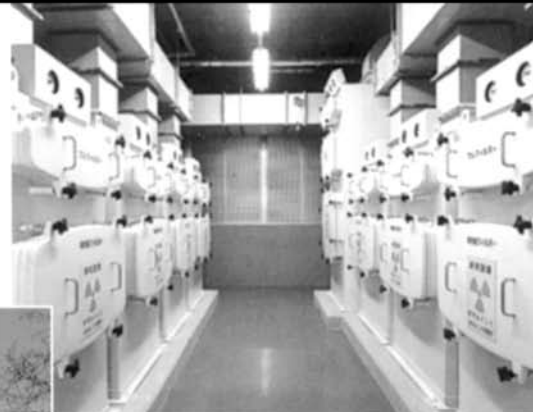
排気フィルターユニット