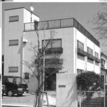
テクニカルセンター