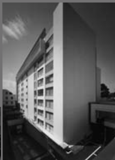
杏林大学医学部付属病院